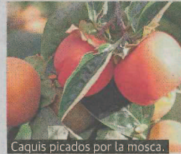
Caquis picados por la mosca.

El último boletín de AVA-Asaja informa de la multiplicación de plagas que afectado al cultivo del caqui, una fruta que al principio de extenderse parecía bastante libre de este tipo de problemas. Ahora, en cambio, cada año tiene nuevos enemigos: los hongos 'mycospharella' y 'ne-